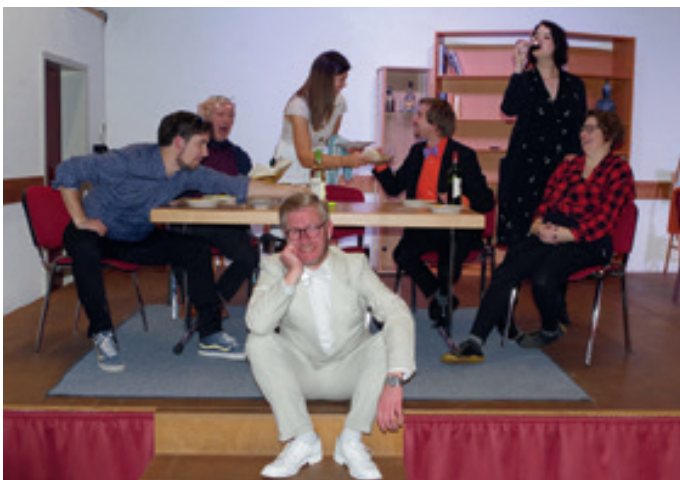
Essen und Trinken, Tränen und Lachen liegen bei dem Abend unter Freunden nah beieinander.

Neugegründete Theatergruppe führt bekannte Komödie auf