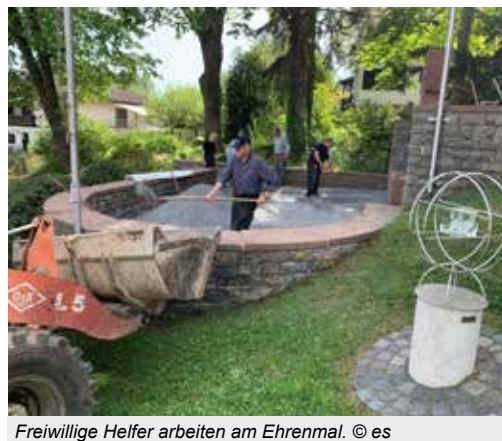
Freiwillige Helfer arbeiten am Ehrenmal.