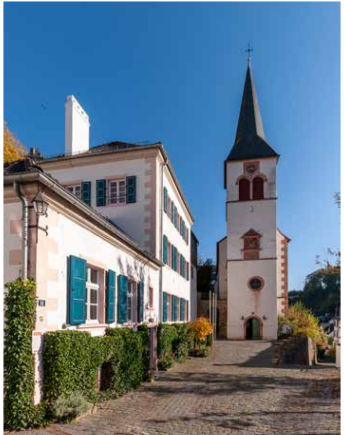
Das Haus am Hirtenurm.

Bei dem Projekt „Hinter der Fassade“ wurden markante Häuser und Gebäude in Blankenheim, hinter denen eine besondere Historie schlummert, mit Informationsschildern ausgestattet.