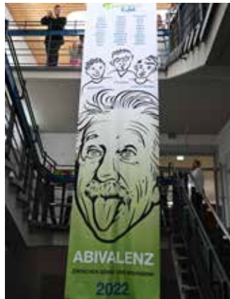
Das Abimotto: Abivalenz – zwischen Genie und Wahnsinn