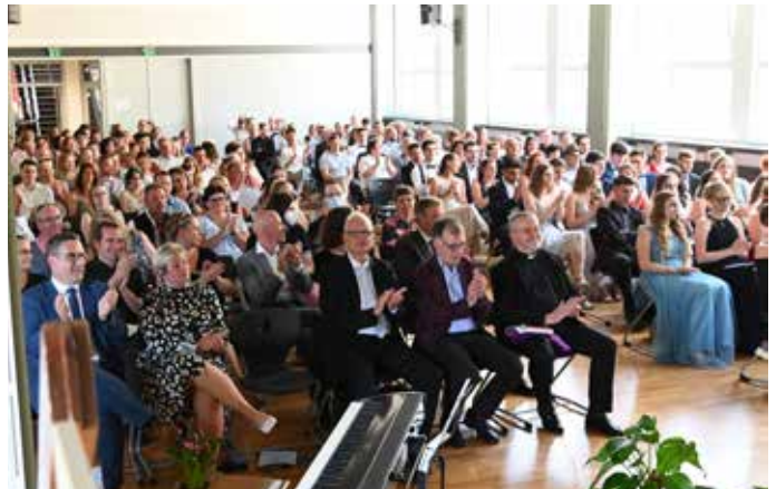
Die Gäste der Veranstaltung.