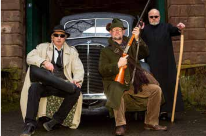
Zum Auftakt der Theatersaison 2022/2023 strapaziert die Eifelgäng am 29. September die Lachmuskeln der Besucher:innen.

Theaterfreunde Schleidener Tal e.V. präsentieren neues Theaterprogramm