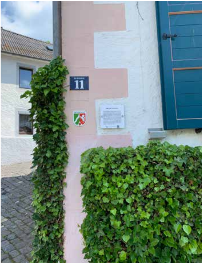
Eine der Tafeln, die im Rahmen von „Hinter der Fassade“ aufgehängt wurden.