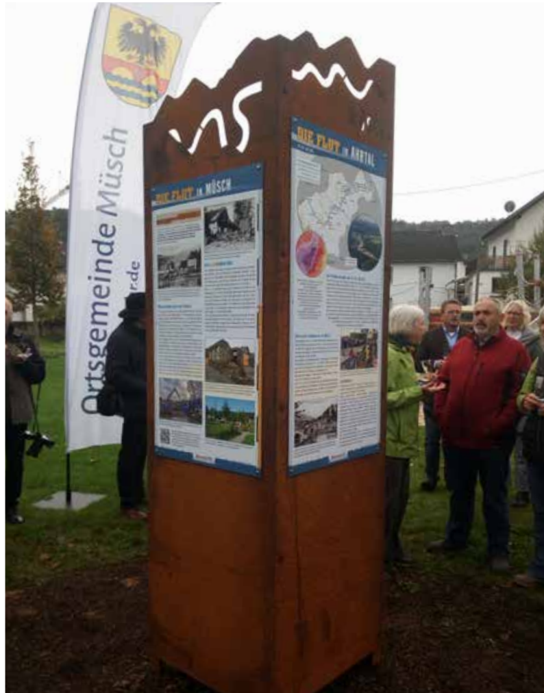
Auch in Müsch steht bereits eine Stele – die erste, die aufgestellt wurde.

Ohne die dreijährige intensive Zusammenarbeit der 31 Mitglieder der Bürgerinitiative und ohne die Finanzierung von Produktion und Layouts durch die flutbetroffenen Kommunen und den Kreis Ahrweiler wäre die Umsetzung des Weges nicht möglich gewesen.