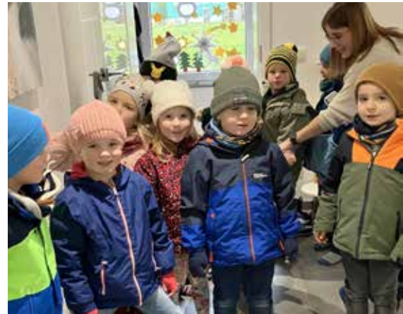
Die Dollendorfer Kindergartenkinder erleben eine abwechslungsreiche und stimmungsvolle Adventszeit.

Musikalisch begleitet wurde die Herbergssuche von einem Trompeter und einem Gitarristen sowie dem Kinderchor aus Dollendorf unter der Leitung von Christina Kothén. Es gab Kinderpunsch und Plätzchen. pp/Agentur Profi-Press