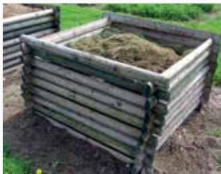
Kompostbehälter mit einer guten Luftzufuhr

Die Mikroorganismen, die an den Rotteprozessen beteiligt sind, benötigen sehr viel Sauerstoff. Voraussetzung für eine gute Sauerstoffversorgung ist ein durchgehendes Hohlraumsystem im Kompost.