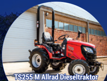
TS255 M Allrad Dieseltraktor