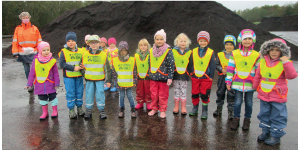
Die „kleinen Strolche“ der DRK-Kita Dollendorf lernen in der Einrichtung viel über Müllvermeidung. Jetzt besuchten sie das Kreisabfallwirtschaftszentrum in Strempt.

„In der Regel wissen die Kinder bereits, dass Abfall nicht gleich Abfall ist, schließlich sind gelbe Tonne und Co. von zu Hause bekannt“, so Bresgen. Aufbauend auf dieses Wissen, lernen die Vorschulkinder im aktuellen Müll-Projekt