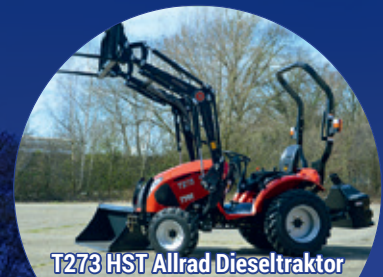
T273 HST Allrad Dieseltraktor