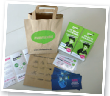
Flyer, Tonnenaufkleber, LogoLoops und Papiertaschen erhalten Sie bei Ihrer Abfallberatung.

Informationen zur deutschlandweiten Kampagne gibt's unter www.wirfuerbio.de . Den Ohrwurm #wirfuerbio von Bufala finden Sie bei youtube.com. ■