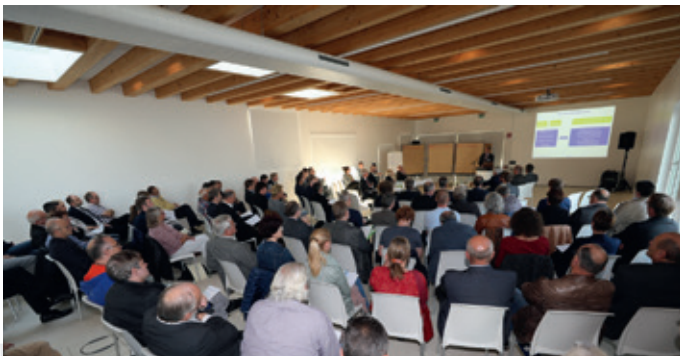
Gut besucht war die Auftaktveranstaltung im Zülpicher Seehaus

Am Montagnachmittag (08.10) sind fast 100 Personen zur Auftaktveranstaltung nach Zülpich gekommen, um gemeinsam den Grundstein zur Gründung eines „Bündnisses für Wohnen“ im Kreis Euskirchen zu legen.