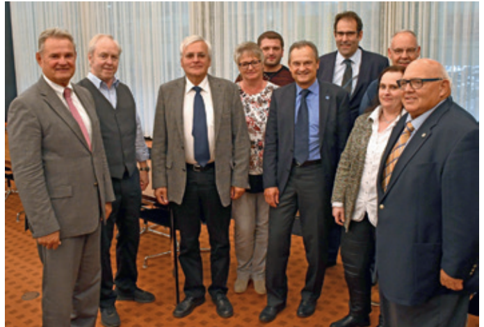
Wie man jüngere Mitglieder für die Mitarbeit im VdK motivieren kann, war ein Thema bei der Versammlung des VdK-Kreisverbandes Euskirchen.