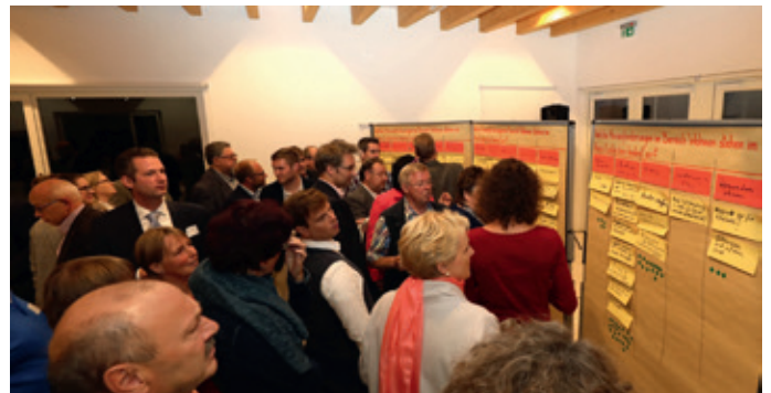
Die Teilnehmer/-innen priorisieren die zuvor gesammelten Handlungsfelder.