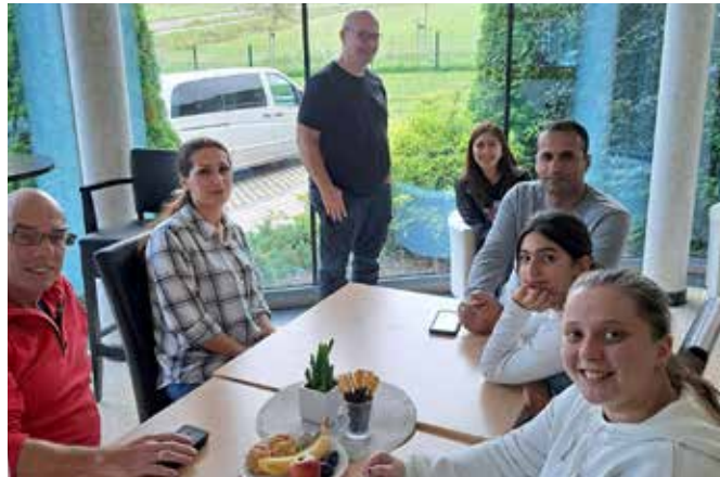
In entspannter Atmosphäre konnten sich die Gäste des Begegnungscafés miteinander unterhalten und neue Kontakte knüpfen.

Im Fokus stehen Begegnungs-, Sprach- und Unterstützungsangebote für Geflüchtete aus der Ukraine. Das Begegnungscafé in Blankenheim mit monatlichen Treffs nahm am 31. August seinen Auftakt, weiter ging es am 14. September. Die nächste Zusammenkunft der Gäste und Helfer ist für Donnerstag, 12. Oktober, vorgesehen.