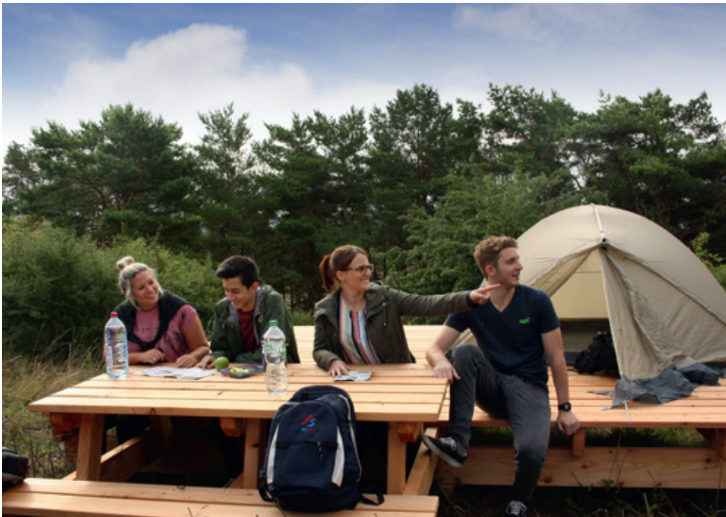
Das neu aufgestellte Team aus dem Bereich Tourismus der Gemeinde Blankenheim vor dem eingerichteten Trekkingplatz

Neuer Trekkingplatz in der Gemeinde Blankenheim