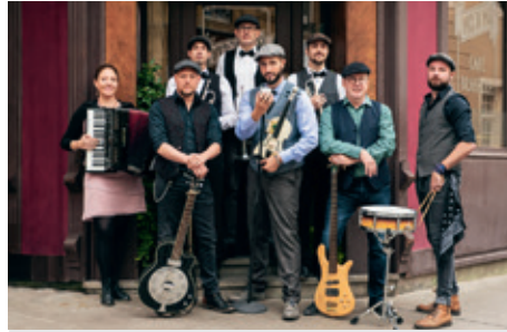
Die Folkrockband aus Luxemburg. „Die Band verfügt über außergewöhnlich gute Musiker, die ausgezeichneten Folkrock machen.“ (Haiangriff 2018)