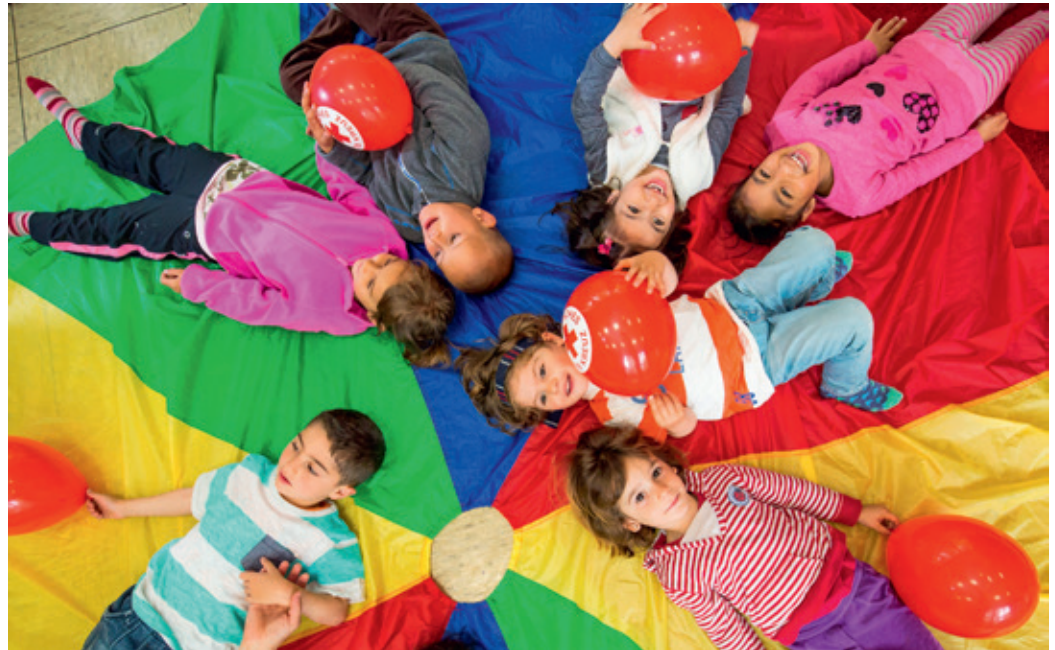
Eine Spiel- und Kontaktgruppe des Roten Kreuzes startet am Freitag, 30. August, 9.30 bis 11 Uhr, im DRK-Familienzentrum Blankenheim.

Eine Spiel- und Kontaktgruppe bietet das DRK ab Freitag, 30. August, für Kinder von ein bis drei Jahren an – Wöchentliches Treffen von 9.30 bis 11 Uhr im DRK-Familienzentrum Blankenheim, Nonnenbacher Weg 5