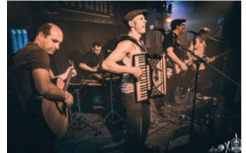
Folkpunk aus den tiefen Wäldern der Eifel. „Tanzen, trinken, feiern, denken, kämpfen, träumen. Folkpunk der besten Sorte.“ (BlattTurbo 2017)

Das Eifeler Folkpunk Festival geht in die siebte Runde! Wie in den vergangenen Jahren hat man es wieder geschafft, authentische, internationale Bands in die Eifel zu locken.