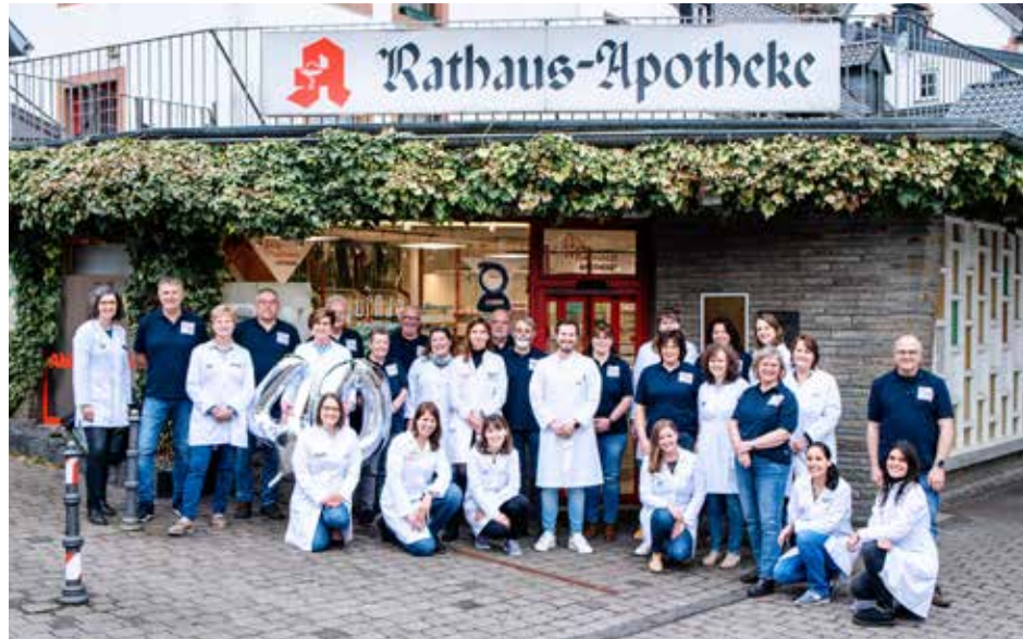
Das Team der Rathaus Apotheke feiert 40 Jahre – feiern Sie mit