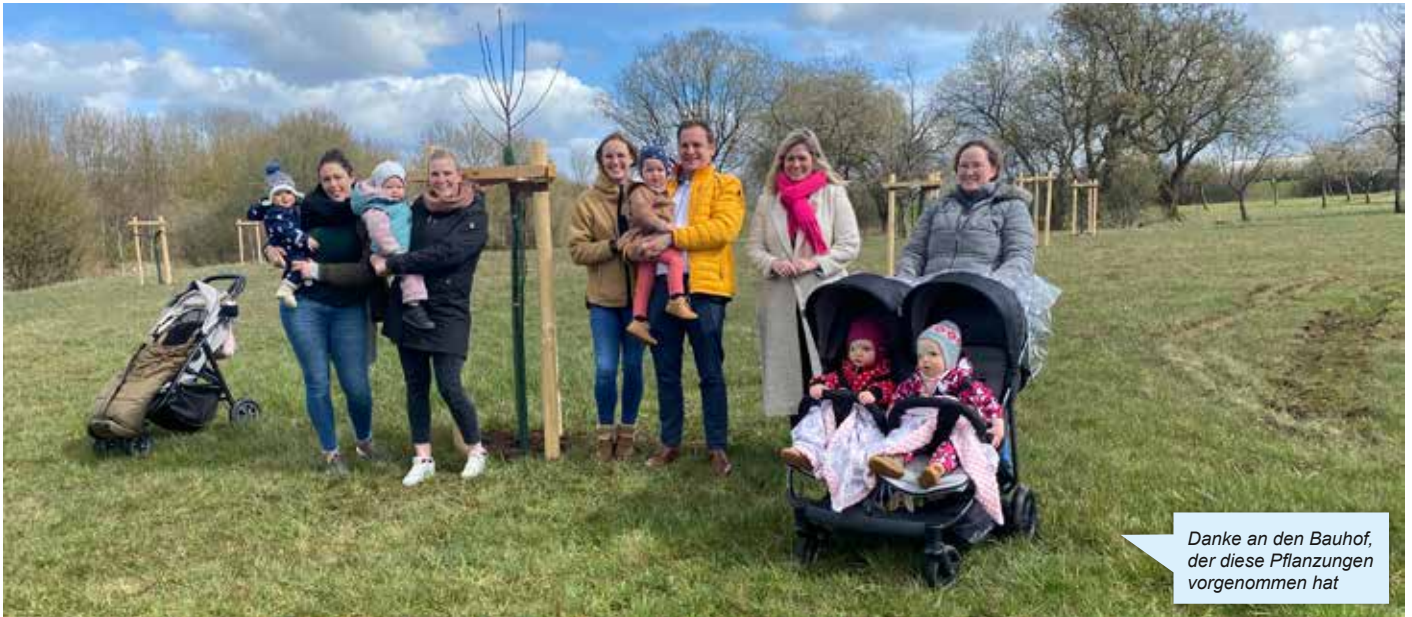
Danke an den Bauhof, der diese Pflanzungen vorgenommen hat

„Big things start small“ – das gilt für viele Bereiche des Lebens. Ob nun für Familien, die mit Zweien starten, oder für Bäume, die klein gepflanzt werden und mit den Jahren an Größe und Kraft gewinnen. Aus diesem Grund hat die Gemeinde Blankenheim das Projekt „Neugeborenenbäume“ ins Leben gerufen.