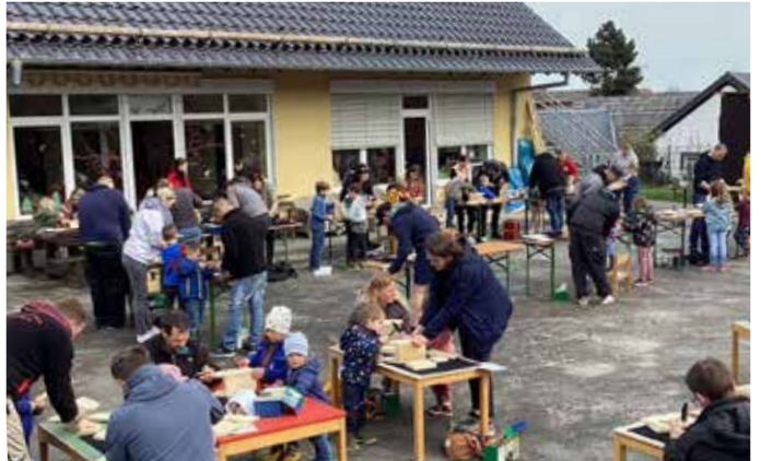
Hochbetrieb herrschte beim gemeinsamen Nistkästenbau auf dem Freihof des Dollendorfer Rotkreuz-Kindergartens „Die kleinen Strolche“.

Im Zuge der Rezertifizierung als Klima-Kita NRW und Nationalpark-Kindergarten wurde jetzt ein Projekt zum Thema „Heimische Vogelbestände in unserer natürlichen Umgebung“ gestartet. Das Kindergarten-Team: „Es wurde unter anderem thematisiert, welche Vogelarten in unserer unmittelbaren Naturkulisse zu finden sind, wie diese überwintern und wie der Lauf der Natur im Frühling vorstangeht.“