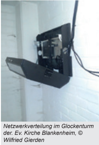
Netzwerkverteilung im Glockenturm der. Ev. Kirche Blankenheim