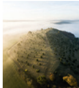
Kalvarienberg Alendorf, © Ziegelberg

Fast 100 kurze und lange Wanderwege aus ganz Deutschland haben sich bei der Fachzeitschrift Wandermagazin beworben, um Deutschlands Schönster Wanderweg 2022 zu werden. Nun stehen die 25 Wege fest, die es in die finale Runde geschafft haben und sich ab dem 03.01.2022 dem Votum eines bundesweiten Wanderpublikums stellen werden. Eingeteilt wird das Teilnehmerfeld in 10 Mehrtagestouren sowie 15 Tagestouren, die jeweils in