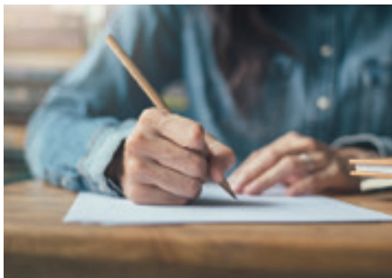
Bis zum 31. Januar 2022 können sich Nachwuchsauctoren beim Wettbewerb des Geschichtsforums Schleiden anmelden.

Dies sind nur einige Anregungen für mögliche Themen, wobei der Kreativität keine Grenzen gesetzt sind. Eltern und Lehrer:innen können dabei behilflich sein. Verwandte oder Bekannte, die in dieser Zeit berufstätig waren, können interviewt werden und alte Fotos beisteuern. Auch Gruppenarbeiten sind möglich.