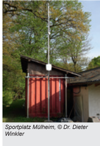
Sportplatz Mülheim, © Dr. Dieter Winkler

Der gemeinnützige Verein „roots at eifel e. V.“ befasst sich mit der Erforschung, Anwendung und Verbreitung freier Funk- und Netzwerktechnologien sowie der Verbreitung des Wissens darüber. Dabei ist die Verbreitung freier WLAN-Angebote zur Internetnutzung einer der Bereiche, die wir in den Fokus stellen. Diese Angebote realisieren wir gemeinsam mit der Freifunk Community. Geografisch sind wir im Gebiet des Kreises Euskirchen aktiv.